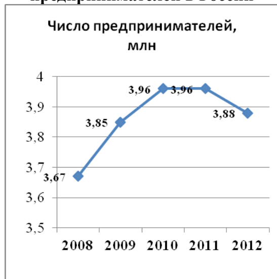
Рисунок 1